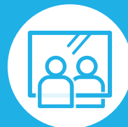
飛沫防止用シート設置