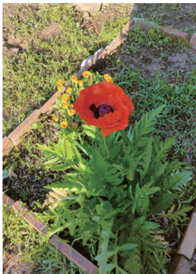
只今土いじりに凝ってます。年末に種を撒いたのが咲きました。オニゲシ、またの名はポピーらしいです。背が75センチ迄に。 (わかくさ支部・ミーちゃん)