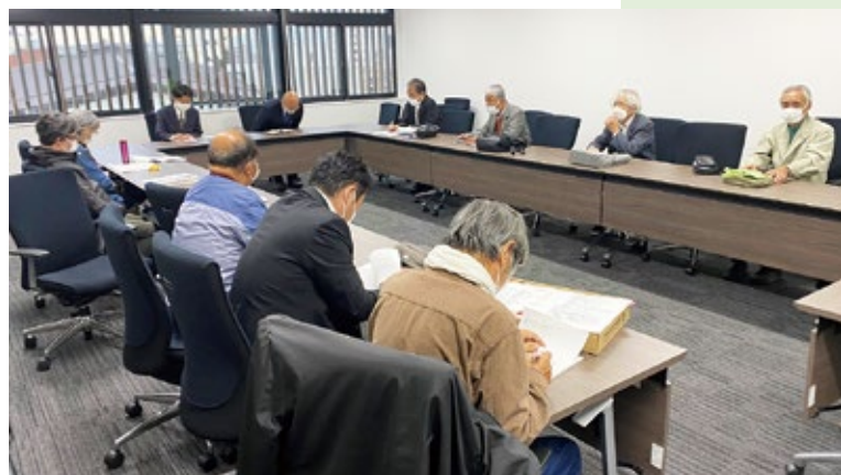
大和郡山市議会への要請(11月7日)

7つの部局に対して交渉をおこないました。友の会としては、医療・福祉・社会保障等の改善を求めて6項目の要求書を提出、福祉健康づくり部、市民生活部などとの交渉に臨みました。今年、前進したのは子ども医療費助成です。私たちはこの問題を、以前から市に対し申し入れをして運動してきました。全国の運動も広がり、ようやく市は今回のキャラバン交渉において、来年4月から18歳(高校生)まで助成する意向を示しました。