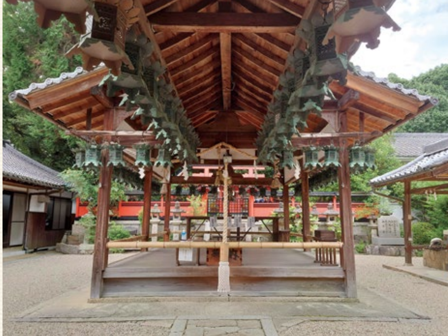
翁舞が披露される拝殿

奈良豆比古神社は、その歴史が古いことはもちろん、有名にしているのは翁舞 おきなまい で、重要無形民俗文化財に