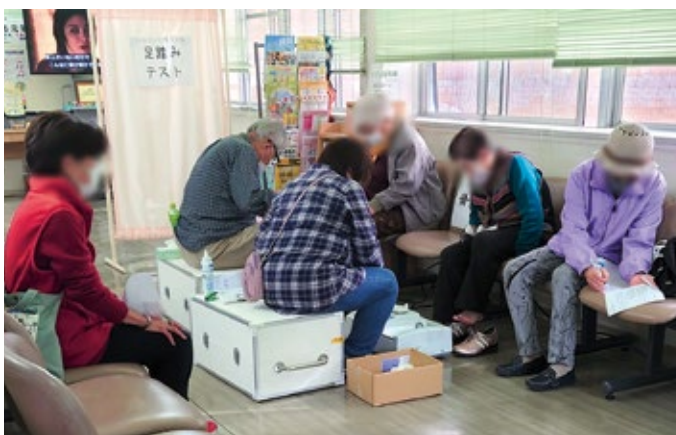
ウクライナ支援バザーで健康チェック（小泉支部）

「憲法改悪を許さない全国署名」は月間中に337筆いただき、岡谷会とあわせて2331筆となっています（1月4日時点）。そして、昨年10月開始の「介護保険請願署名」も