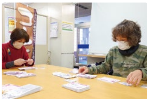
健康づくり部会で各賞の発送準備

※前号2面で参加者が「315名」とありましたが、正しくは「314名」です。お詫びして訂正いたします。