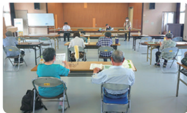
わかくさ支部総会