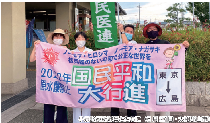
小泉診療所職員とともに (6月27日・大和郡山市)

険薬局等も無低診の対象とするよう国への働きかけと、自治体として無低診にかかる院外処方箋での薬代自己負担金を減免対象とする助成制度の設立を要望する署名に取り組んでいます。前号の機関紙に署名用紙を同封して発信しておりますので、いのちと健康をまもるためご協力をお願いします。