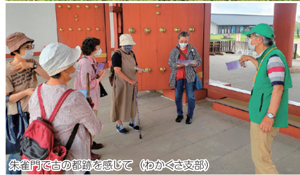
朱雀門で古の都跡を感じて（わかくさ支部）