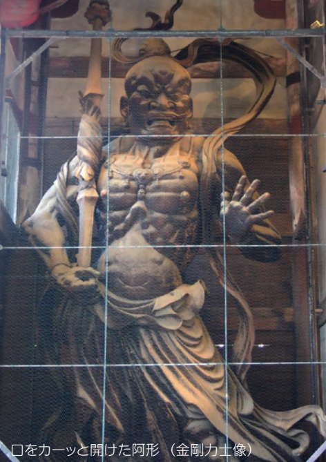
口をカーッと開けた阿形（金剛力士像）

東大寺南大門（奈良市雑司町） 最寄り駅 JR奈良駅・近鉄奈良駅 奈良交通 市内循環バス「大仏殿春日大社前」下車、徒歩5分