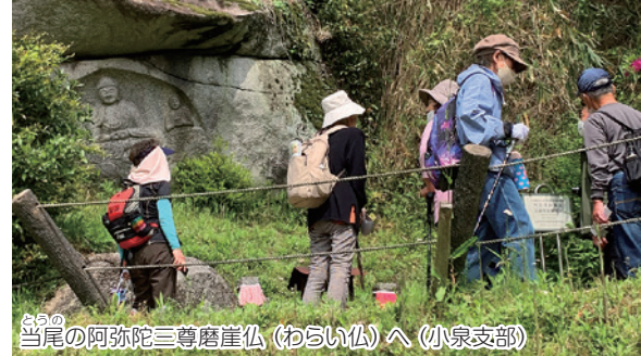
当尾の阿弥陀三尊磨崖仏（わらい仏）へ（小泉支部）