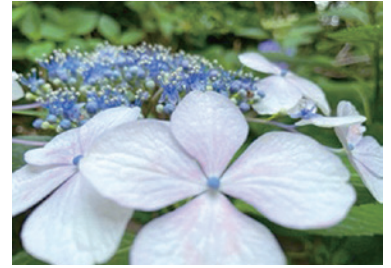
久米寺は橿原市にある古刹です。紫陽花でも有名でこの時期、静かな久米寺が、色とりどりの紫陽花色に染まります。(春日支部 岩城 和美)