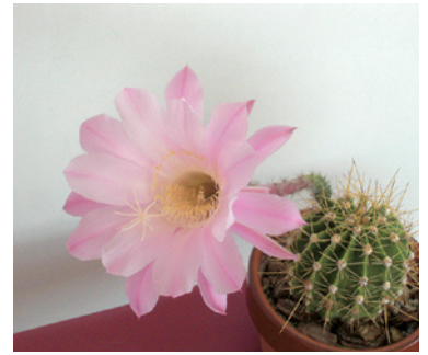
運動施設の中、会員の皆さんの熱気で1日限りの大輪の花を咲かせています。(メディカルフィットネス あおがき)