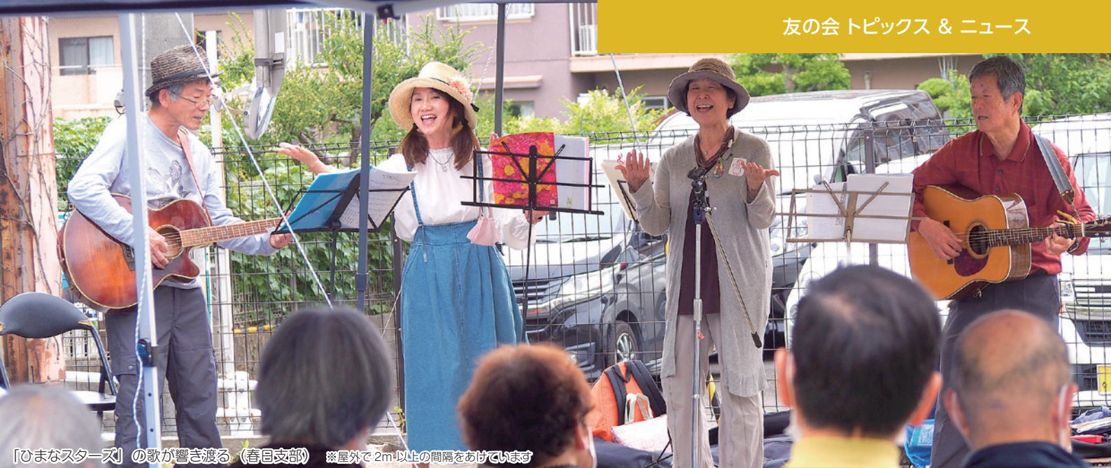
「ひまなスターズ」の歌が響き渡る（春日支部） ※屋外で2m以上の間隔をあげています