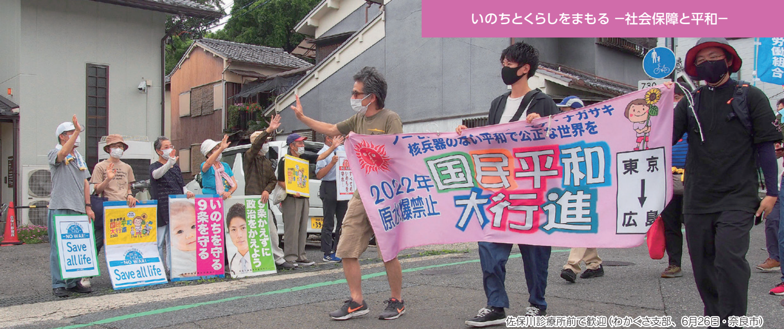
佐保川診療所前で歓迎(わかくさ支部、6月26日・奈良市)