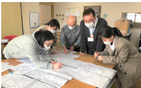
地図に会員宅をチェック (あすか支部)

ど地域を訪ね、さまざまな形で友の会のことを知っていただきました。新入職員からは「地域に暮らす人々が安心して住み続けられる地域づくりを積極的にこなっていることを学んだ」「友の会は地域住民にとつて無くてはならない存在であると感じた」「改めて新型コロナウイルスの影響が大きかったです。その中でも、できることをおこない地域の方々に少しでも健康でいてもらいたいという思いも感じました」といった感想が寄せられ、友の会や支部のこと、地域を知る研修となりました。