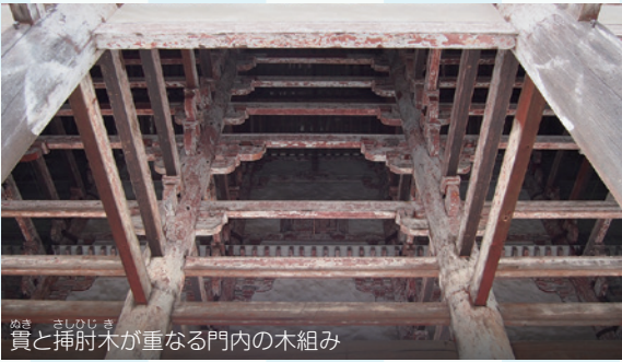
貫と挿肘木が重なる門内の木組み

り、柱の上部の貫※ 1 と柱の途中から突き出す挿肘木※ 2 の組み合わせが、これでもかと組み込まれている。重源がなぜ大仏様・天竺様にこだわったかというと、南大門は平安期に大風で倒壊しており、体裁より耐久性を求めたからである。誠に荒っぽく見えるが、シンプルかつ実用的で、耐震性に富み極めて強いのが特徴である。また、建設には大陸の技術を大いに取り入れるため、工人の陳和卿を呼び寄せ協力を得ている。