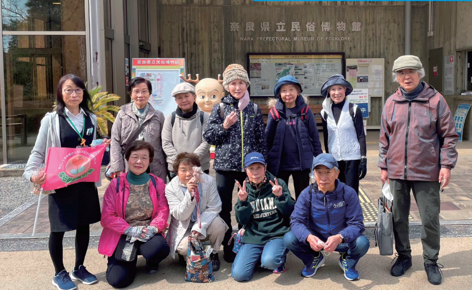
久しぶりの企画で集まり、開催できてよかった（撮影時のみマスクを外しています）