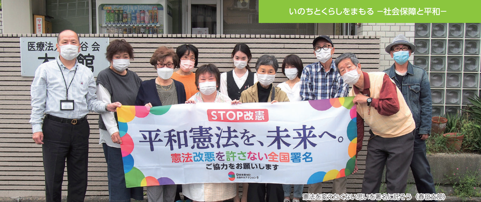
憲法を変えたくない思いを署名に託そう（春日支部）