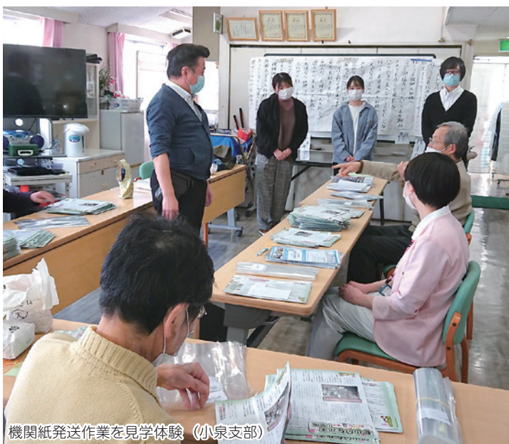
機関紙発送作業を見学体験 (小泉支部)

都南支部や小泉支部では4月号の機関紙発送作業を体験、あすか支部では地図に機関紙を届ける会員宅をチェックして手配りを、三笠支部でも近隣地域の機関紙手配りを体験、わかくさ支部では奈良少年刑務所な