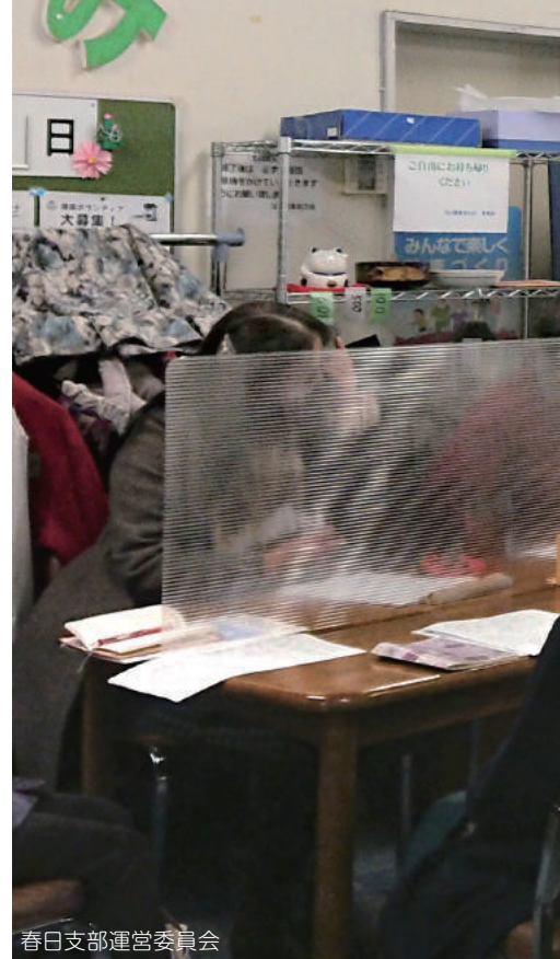
春日支部運営委員会