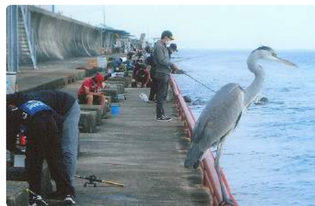
平磯海釣り公園に釣行した時、私の横にアオサギがとまり美しい姿に見とれました。(都南支部 泉 勻)