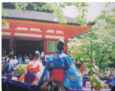
桜井談山神社初春(春分)の蹴鞠祭です。(小泉支部 花坂 志郎)