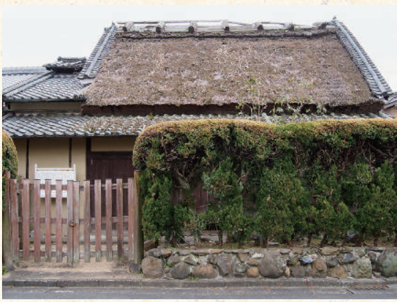
大和造りそのままの旧細田家住宅（奈良市指定有形文化財）

大和造りで、急傾斜の草屋根の下に、ゆるい傾斜の瓦屋根が煙出しまで伸びている。間取りは田の字型で、玄関は正面で入ればす