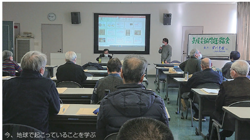
今、地球で起こっていることを学ぶ