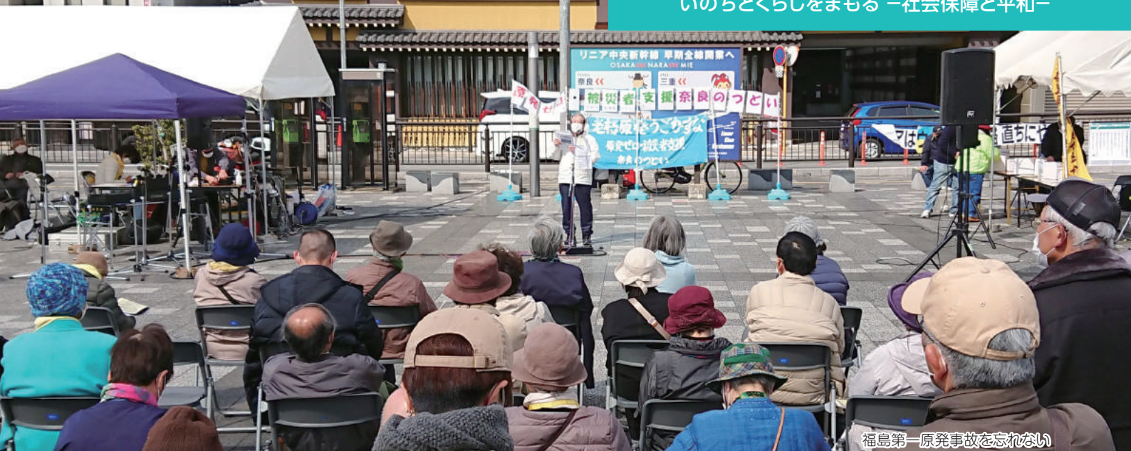
福島第一原発事故を忘れない