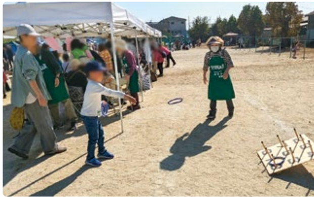
あすかフェスティバル