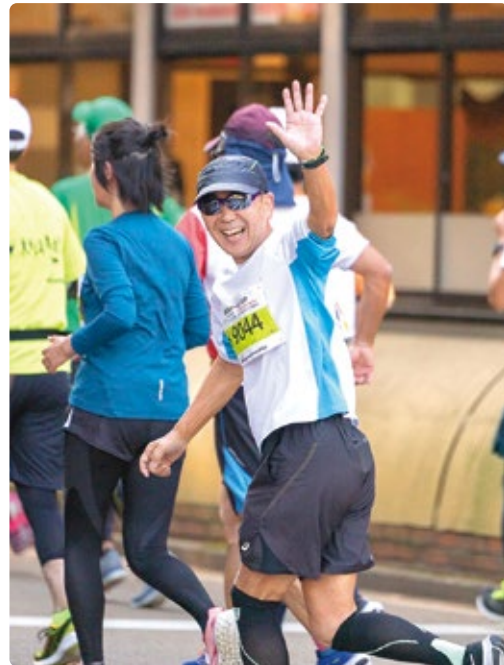
「奈良マラソン」笑顔で完走! (春日支部 odamari)