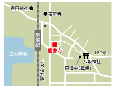
龍象寺 奈良市柴屋町(帯解本町) 最寄り駅 JR帯解駅