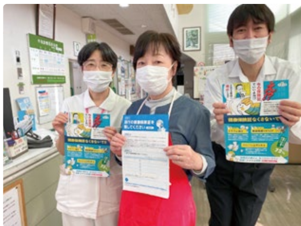
熊澤会長（写真中央）

皆さんはこの秋に現行の紙の保険証を廃止してマイナンバーカードに一本化するという政府の決定をご存知でしょうか。またマイナンバーカードを持っていない人、お年寄りや様々な障害を抱えている人もいる中で、顔認証や暗証番号を入力することは容易なことではありません。年を取れば内科に整形、歯医者に眼科、トランプができるほどの診察券に加