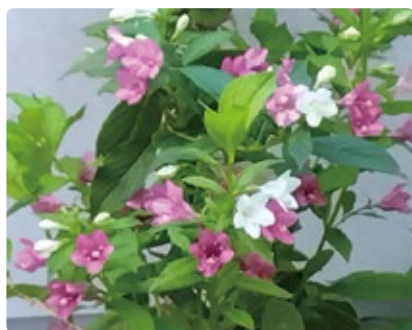
◀「空木の花」買物の道中、白とピンクのウツギ(空木)の花が目を引きます。初めは白く咲き、ピンク、赤へと変化するそうです。それにしても5~6月に咲いて、いま再び花を咲かせ、彼らも忙しいことでしょう。(あすか支部 日ハムファン)