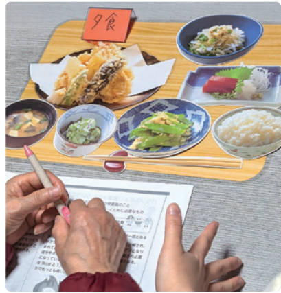
参加者がセットした夕食の献立例

を見直し免疫力を上げることができ、内容から始まりました。「喫煙を控える」「睡眠を十分とる」「思い切り笑う」などの食事の事だけではなく色々な方面からのお話でした。最後は、勿論食事のお話で免疫力を高める食材の具体例、免疫細胞そのものを活性化させる栄養素、タンパク質・ミネラルであるビタミンA・ビタミンEの含まれる具体的な食材の話で終わりました。