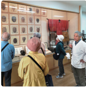
奈良豆比古神社 資料館