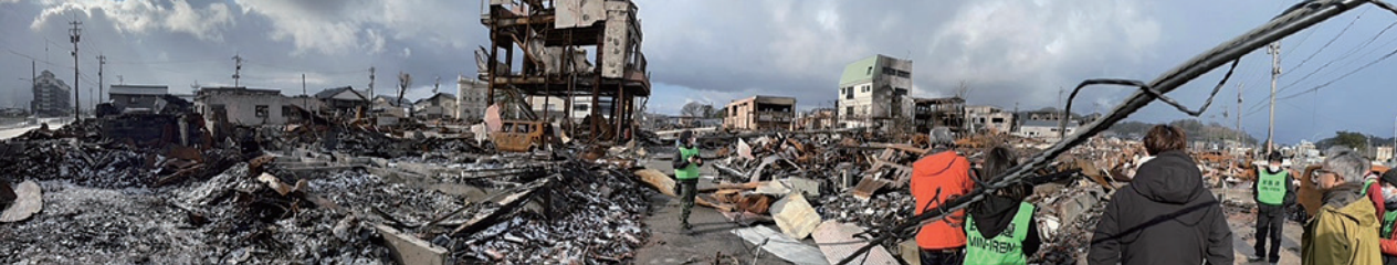
火災があった元輪島朝市

全日本民医連から支援の要請があり、3月20日～22日に輪島診療所を中心に友の会会員の地域訪問行動と、家の片づけ作業のお手伝いを行ってきました。2月末から始まり、第8クールにあたり全国から11名が集結しました。