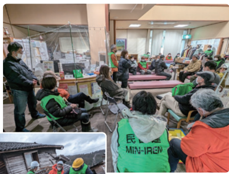
支援スタッフミーティング

片付け作業には3日間で合計3軒のお宅に入りました。どの家も震災直後から手が付けられていない状態でした。1軒目には輪島診療所の向かいにある友の会居場所「友の会サロン輪茶」の2階の片