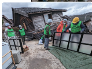
片付け作業の様子

感じたことは、①片付けは一人ではできないのでこうしてたくさん的人数で一気にすべき ②3月いっぱい避難所を出ないといけない↓次の住居を行政が責任をもって提供しないと