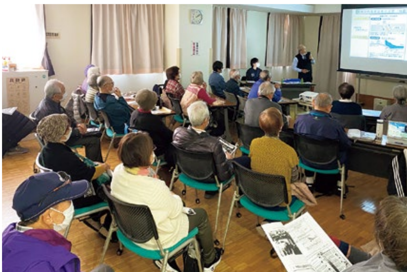
奈良市防災学習会

時間30分を予定していましたが、急遽早めに終わらせて次へ向かわなければならなくなったとの事で、質疑応答の時間が十分とれなかったのは残念でした。