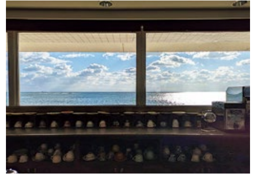
淡路島東浦にて。