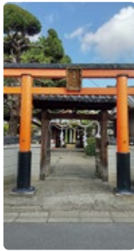
飛鳥神社 京終天神社とも呼ばれている