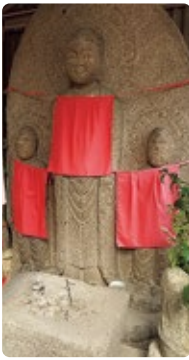
京終地藏院ですが 地藏菩薩ではなく 阿弥陀三尊である