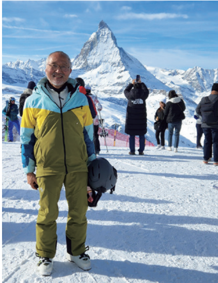
71歳にして初めての海外スキー。ヨーロッパアルプス・マッターホルンを背景に! 2025年1月29日撮影 (がんちゃん)

投稿先 / なら健康友の会 事務局 E-mail : nara.kenkou.tomonokai@gmail.com