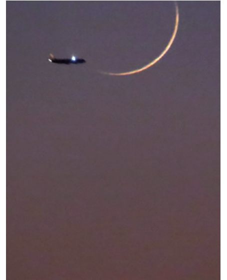
1月1日夕方6時、お月様を撮ろうとファインダーを覗いていたら、突然飛行機が…! (春日支部 にこ)