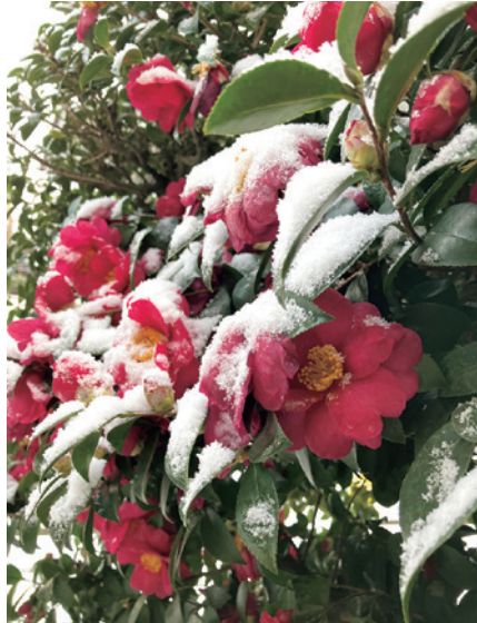
「薄雪の朝」 自宅玄関に咲き誇るサザンカが真っ白な雪を背負っていました。(おまる)