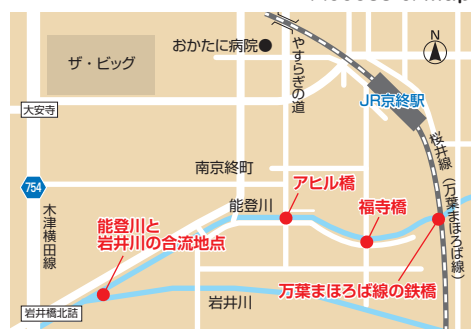
Access & Map