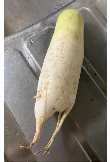
種蒔きと収穫→私、育成→父。目を離したら 両脚を使って逃げて行きそう…!? (おまる)