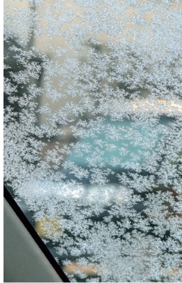
「愛車に咲いた雪の結晶」 (春日支部 きっちゃん)