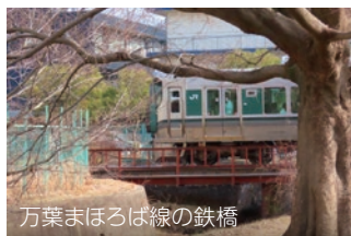
万葉まほろば線の鉄橋

おかたに病院から南に向かって歩くと、ほどなく小さな川に架かる「アヒル橋」に着きます。かつて、この木の橋の流れで、近くに住まわれている方が、アヒルを遊ばせていたのだ、この橋を渡っていた園児達が「アヒル橋」と名をつけたそうです。橋を南に渡って川沿いに東へ進み、福寺橋を左に見て進めば、万葉まほろば線の鉄橋が見えてきます。