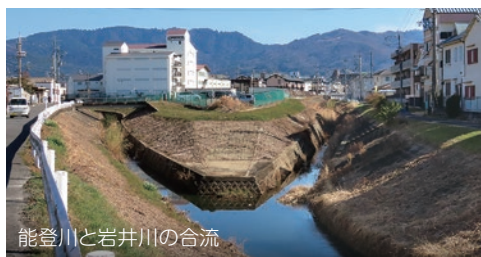
能登川と岩井川の合流

アヒル橋の上立って東の方を見ると高田山と春日山の間が谷になって、アヒル橋の下を流れて、今、私の立っている小さな木の橋の下を流れ去っていきます。この小さな流れ「能登川」は、高田