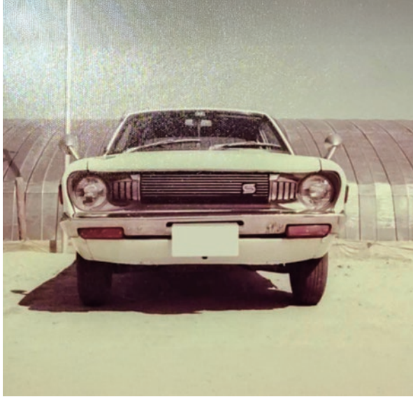
免許取得して初めての愛車S49年式日産のサニーです (華阪記)

投稿先 / なら健康友の会 事務局 E-mail : nara.kenkou.tomonokai@gmail.com