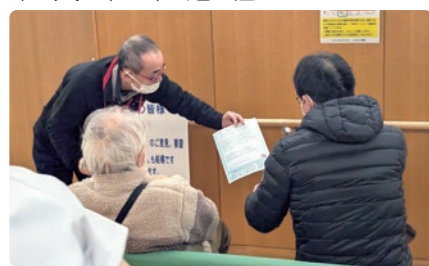
おかたに病院待合室にて

協力をお願いしています。やはり「物価が上がり生活が苦しい」「年金だけでは不安」「今は大丈夫だが将来