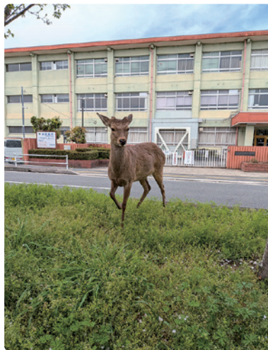
「大安寺西小学校前に鹿さん」

恒例の佐保川のお花見、今年は大安寺西小学校前に鹿さんが遠征しに来てました。「無事に奈良公園へ帰るんやでえ～」と鹿さんに言っておきました。