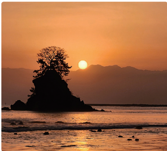
「富山県雨晴海岸から見た朝日」

投稿先 / なら健康友の会 事務局 E-mail : nara.kenkou.tomonokai@gmail.com